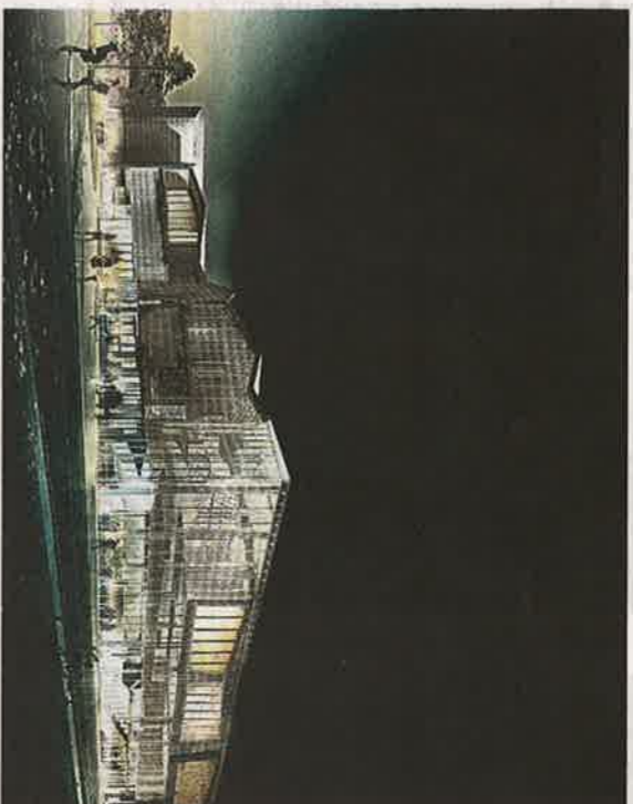
Kostbart: Byggingen av kulturhus i Stjørdal til vel 700 millioner må delvis finansieres med låneopptak.